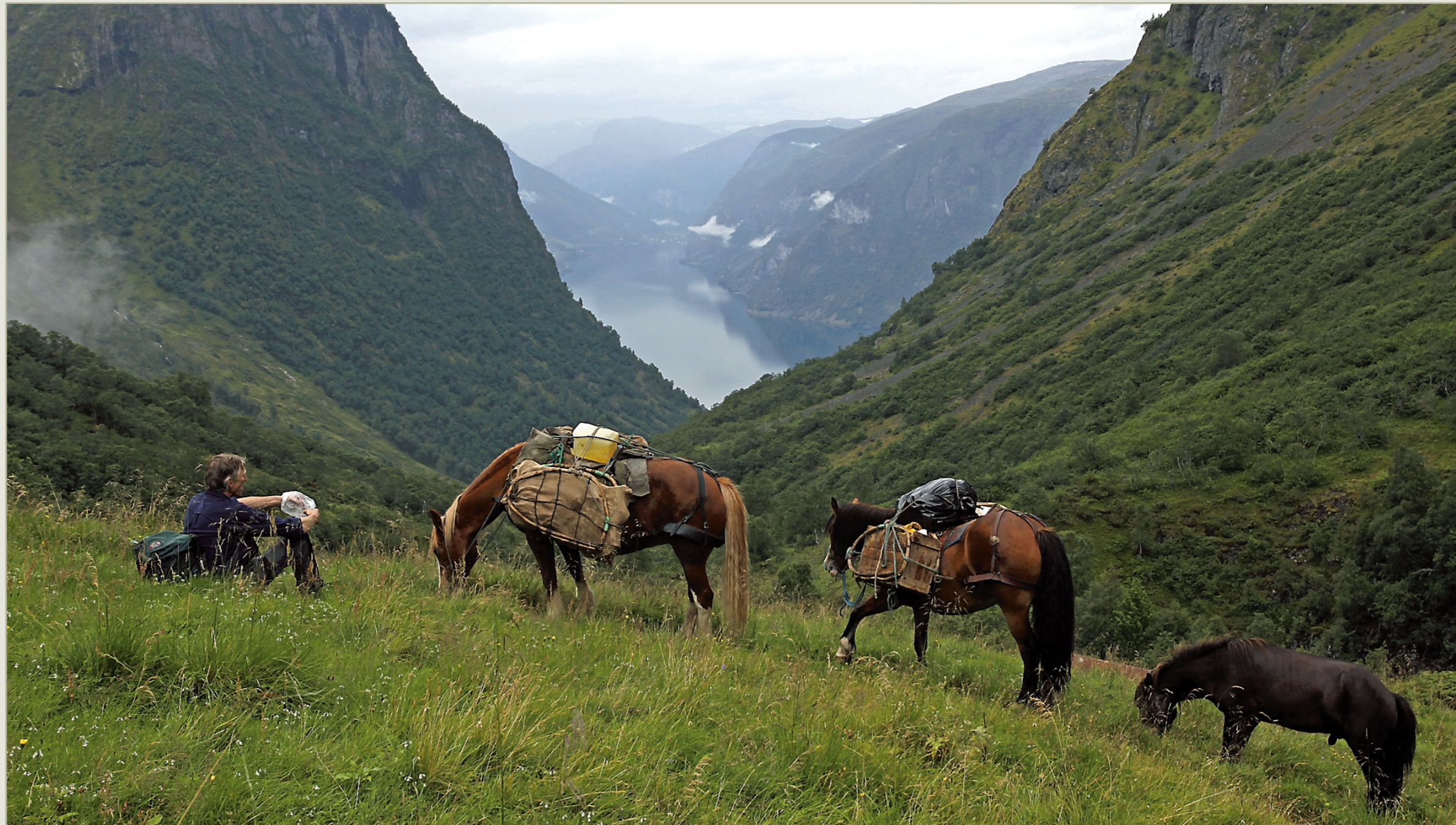
UTSYN: Om lag 700 m stigning er det oppetter til fjellstØlen, difor er det på sin plass med ein liten beitepause på ein gamal nedlagt stØlsvoll.