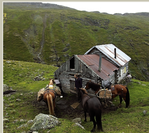
IDYLL: Endeleg framme på ØystØlen, her osar av stØlsmiljø og den herlege lukta av nyysta brimost.