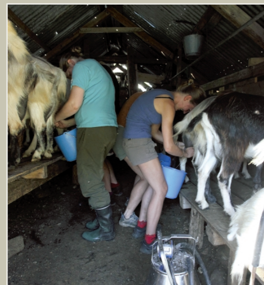
INTENS: MjØlkjanga går føre seg både for hand og med maskin.